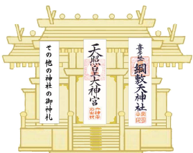
三社造りの神棚の場合

基本的には、お受けになられる方が一番大事にしたい神さまの御神札をお祀りになられるのが結構ですが、本義に基づいてお祀りされるのであれば、伊勢神宮、地元の氏神さまの御神札、個人的に崇敬されているお宮の御神札をお祀りされると良いでしょう。